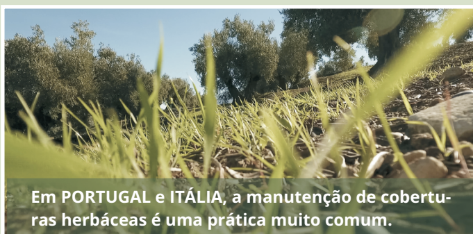
Em PORTUGAL e ITÁLIA, a manutenção de coberturas herbáceas é uma prática muito comum.

Os países e regiões produtores de AEV são caracterizados por combinações próprias de práticas de gestão dos olivais. Tais combinações resultam das características socioecológicas e socioeconómicas, tradições, cultura e barreiras económicas em cada território.