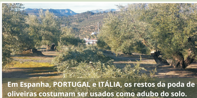
Em Espanha, PORTUGAL e ITÁLIA, os restos da poda de oliveiras costumam ser usados como adubo do solo.