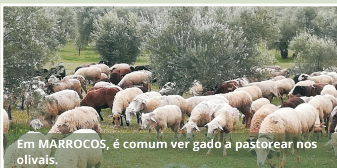
Em MARROCOS, é comum ver gado a pastorear nos olivais.