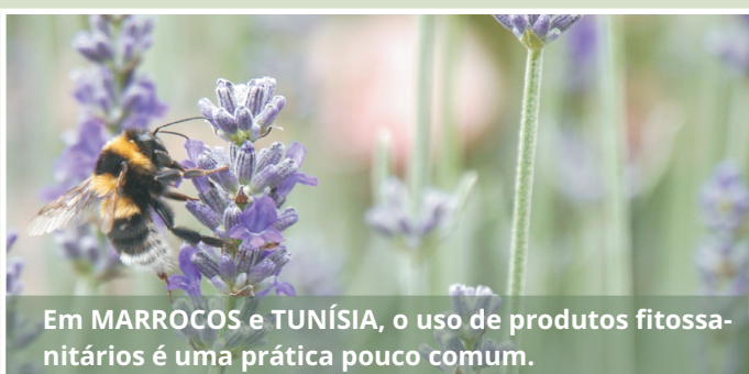
Em MARROCOS e TUNÍSIA, o uso de produtos fitossanitários é uma prática pouco comum.