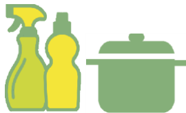
تنظيف أدوات المطبخ

يزيل الشحوم عن الأسطح ويزيل الأوساخ المتراكمة